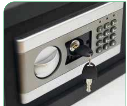
Dispone de llave de emergencia tubular para su uso en caso de olvido del código secreto.